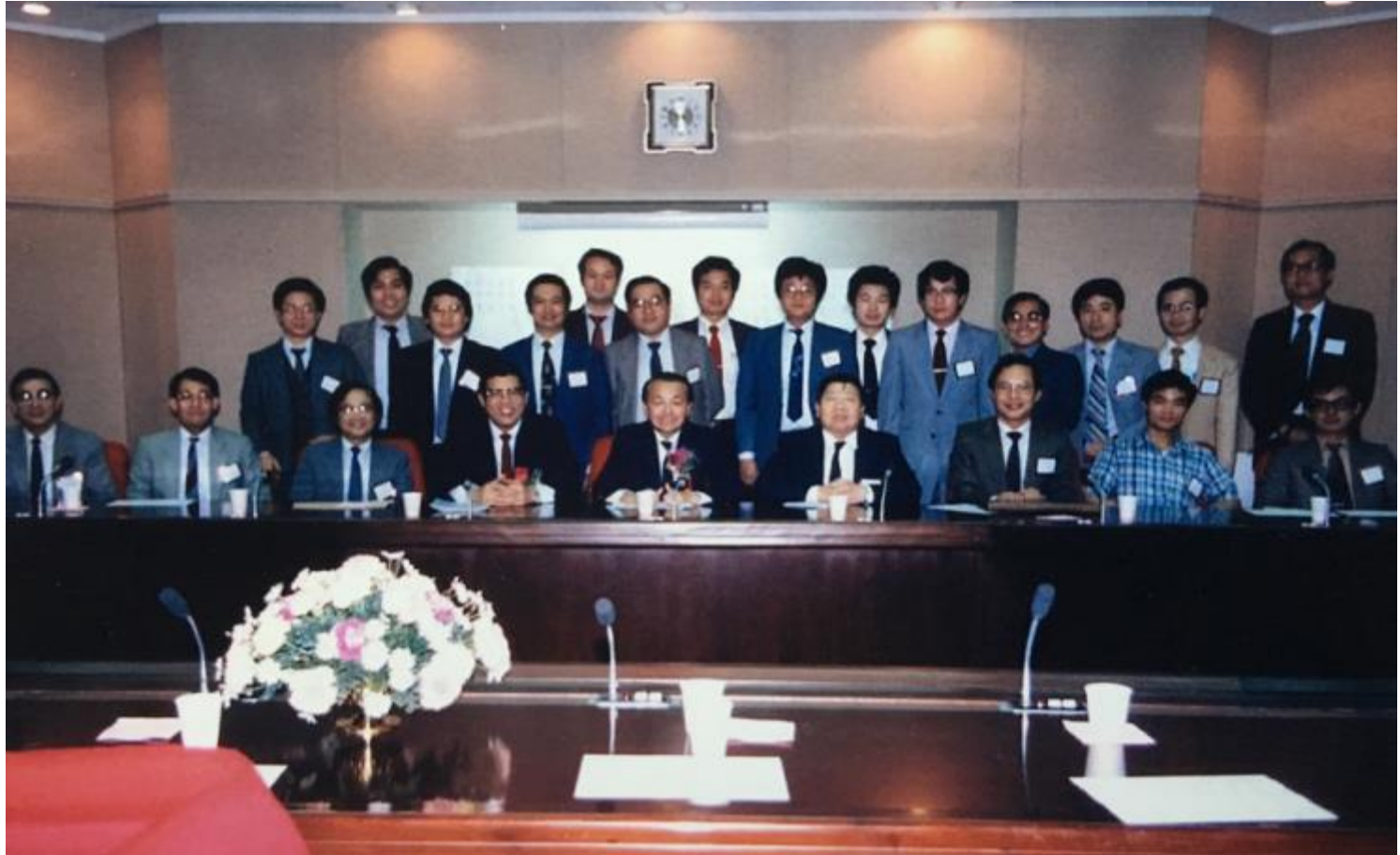
成立中華民國核子醫學會，1987. 3. 08