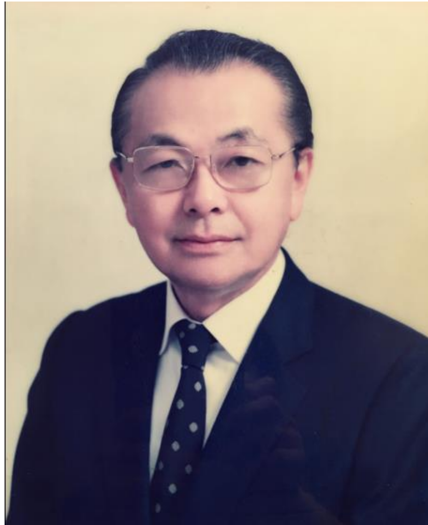
葉鑫華教授（ 1928 - ）