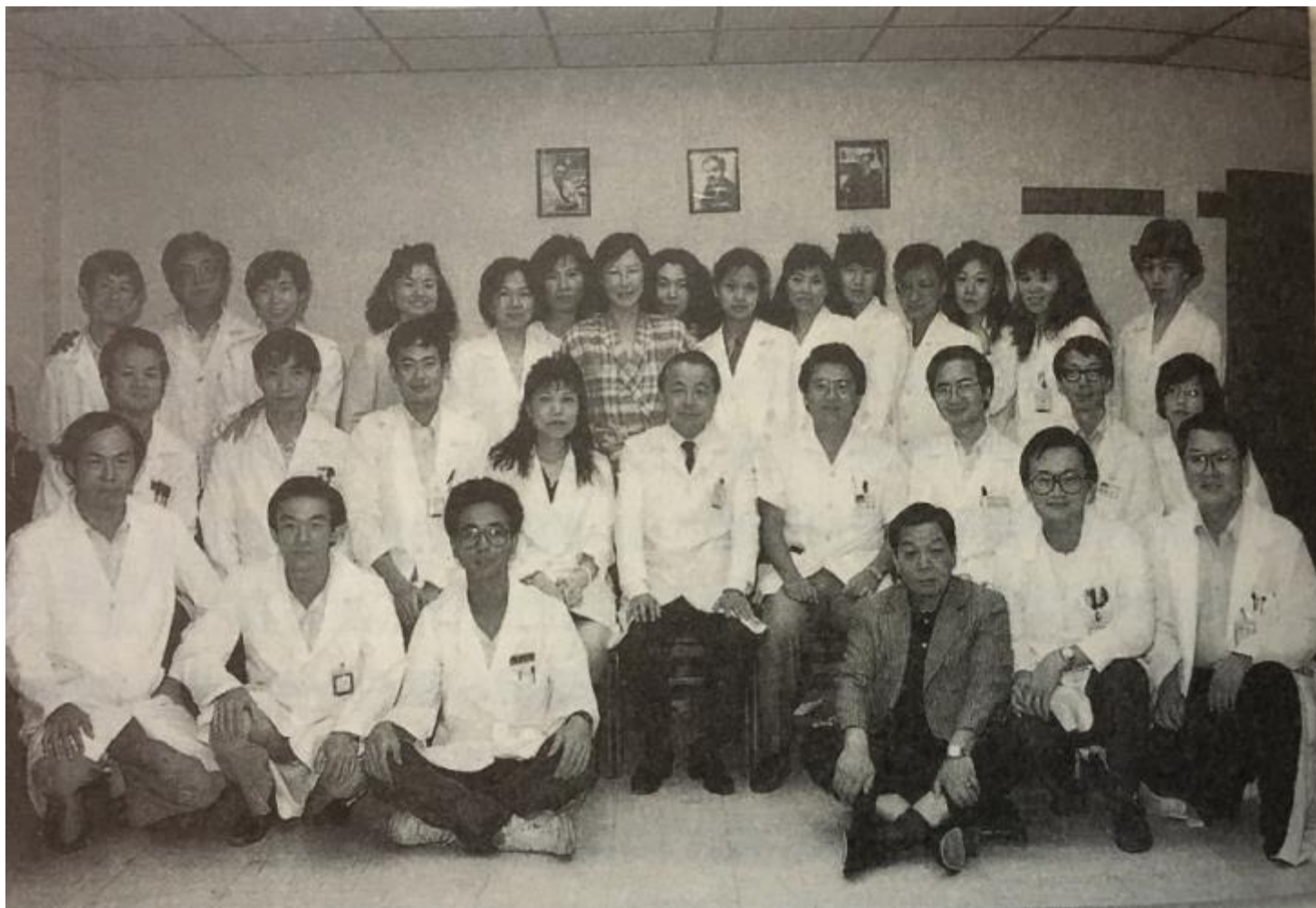
啟用國家多目標迴旋加速器中心，1992