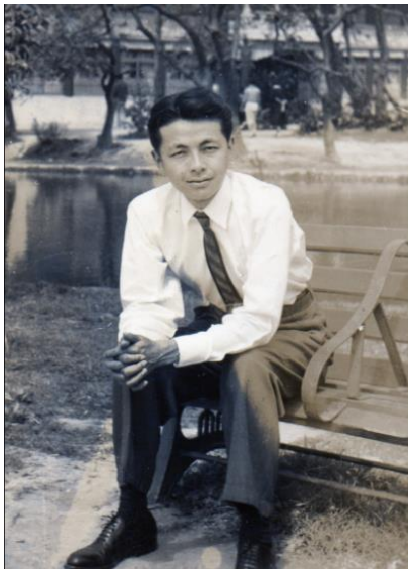
年輕時的葉鑫華教授，1950