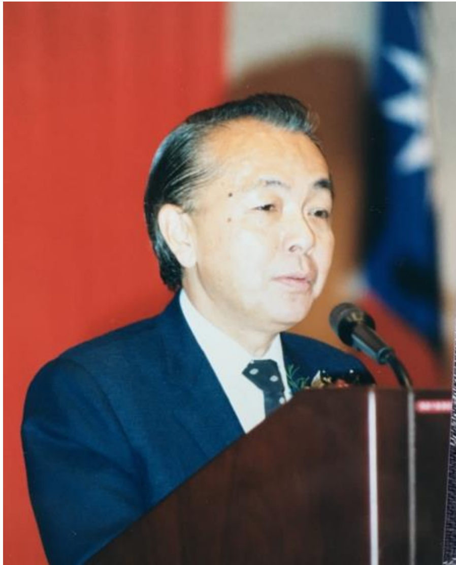
亞洲大洋洲核醫學會演獎，1988